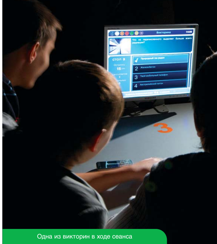
Одна из викторин в ходе сеанса

Все демонстрируемые программы предлагают зрителю широкие интерактивные возможности в форме увлекательных игр и викторин.