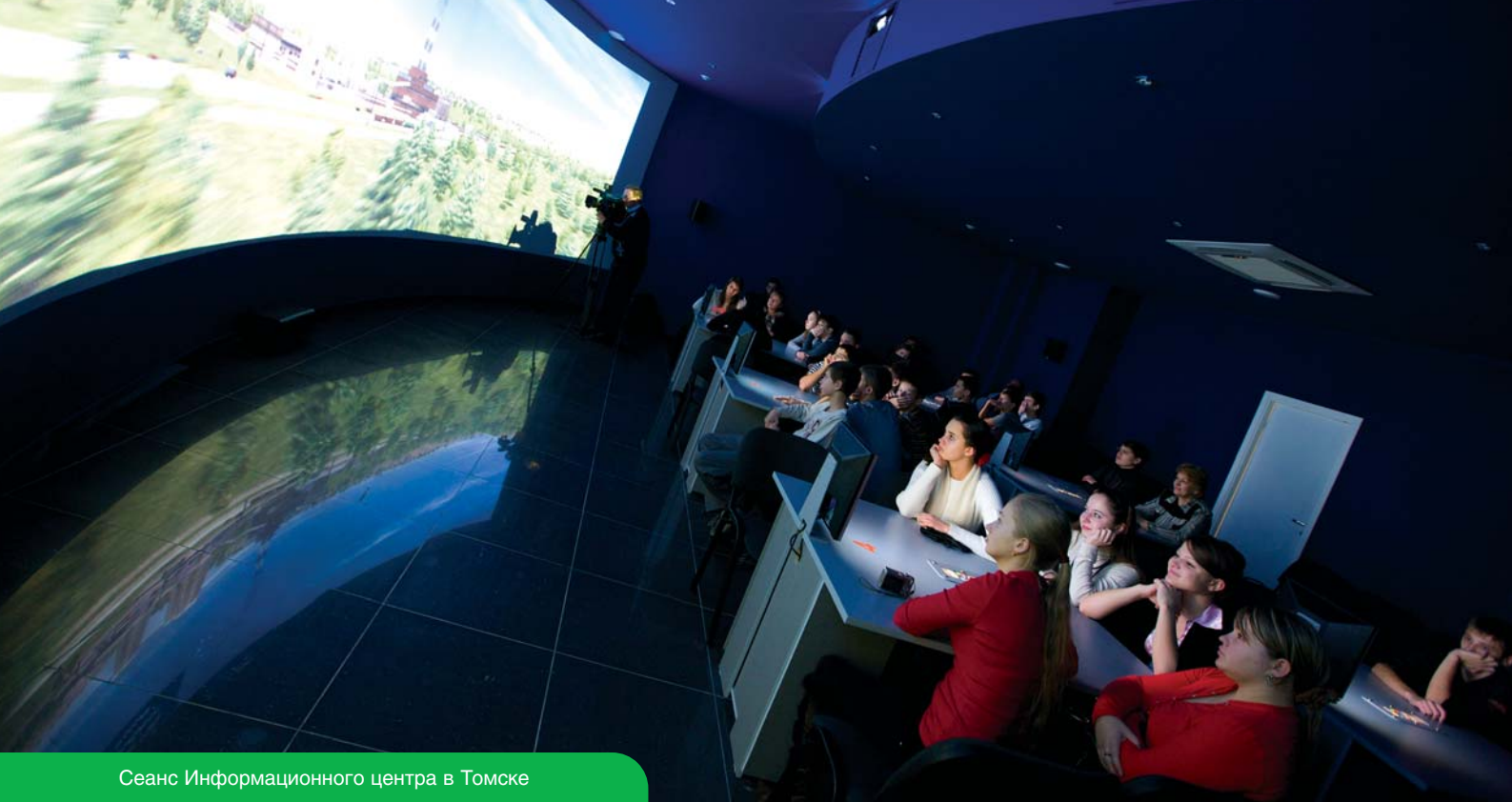
Сеанс Информационного центра в Томске

Информационные центры, обладающие уникальным техническим оснащением, предлагают широкие возможности для размещения информации о вашей компании и ее продуктах.