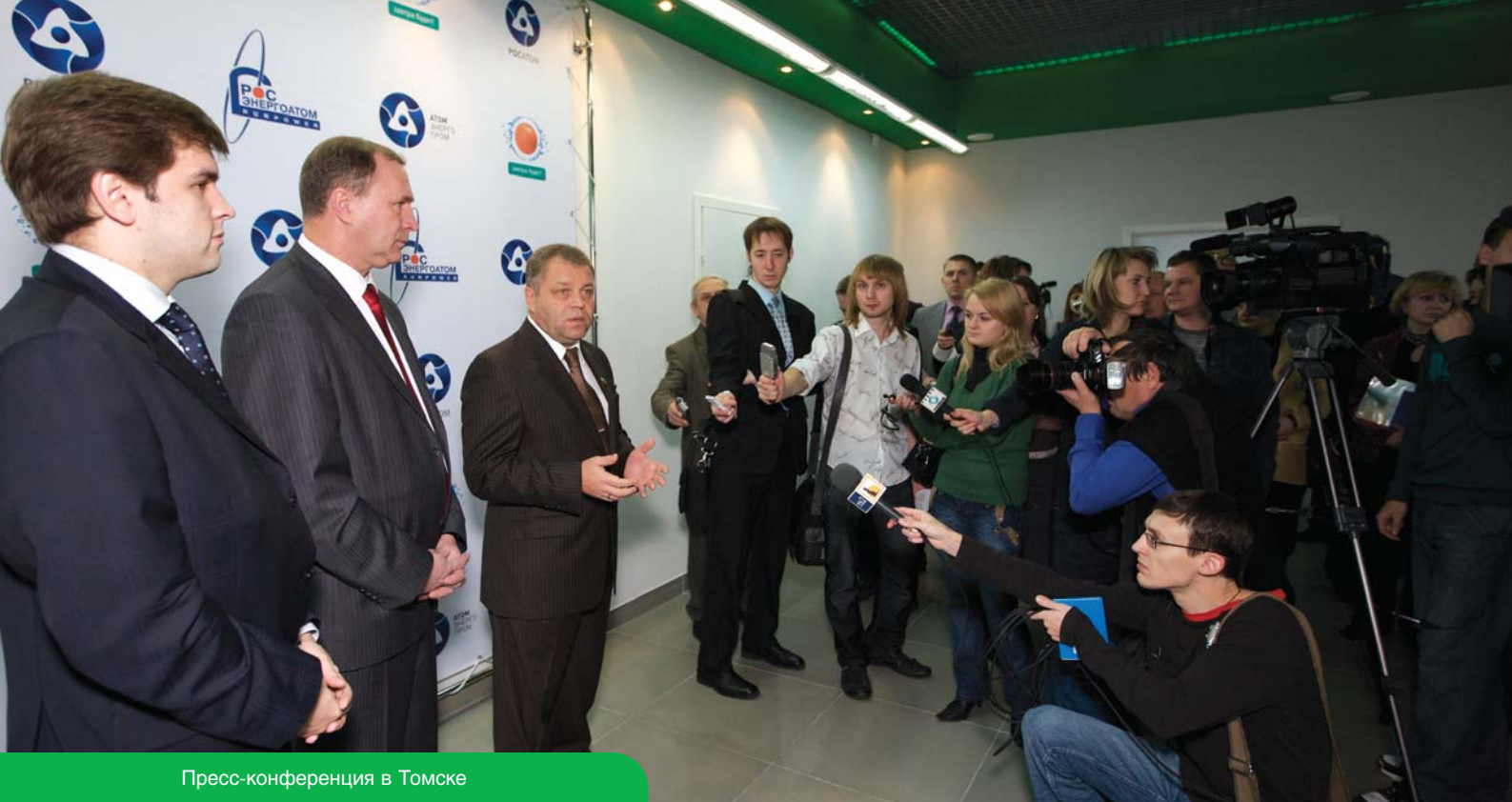
Пресс-конференция в Томске

Информационные центры представляют собой многофункциональные коммуникационные площадки, возможности которых могут быть использованы в интересах вашей компании, от размещения информационной и рекламной продукции на широком спектре носителей до проведения специальных мероприятий (BTL-программы, встречи, выставки, конференции, мероприятия для СМИ и проч.). Индивидуальный подход к географии сотрудничества, а также к его содержательному наполнению гарантирует максимально точное соответствие возможностей сети информационных центров интересам партнера.