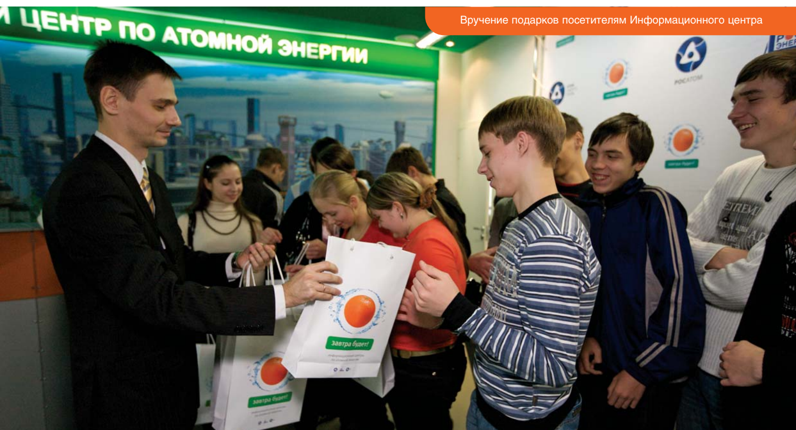
Вручение подарков посетителям Информационного центра

Центры уже сейчас зарекомендовали себя, как известные региональные площадки информационной, общественной и научной активности. Помимо регулярных мультимедийных сеансов, на их базе проводятся выставки, конференции, семинары, встречи, мероприятия для СМИ, работников образования и общественных деятелей.