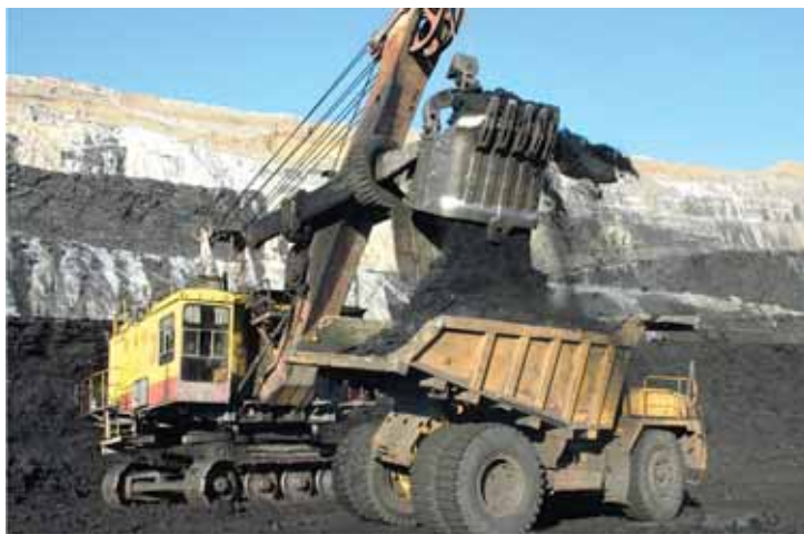
Погрузка в урановом карьере

В этом случае бурится глубокая шахта, и руда добывается с помощью специальных машин, после чего доставляется на поверхность в виде крупных кусков. В России такой способ добычи применяется на «Приаргунском производственном горно-химическом объединении» (ППГХО, г. Краснокаменск, Читинской области). В случае, если урановые руды залегают неглубоко, то организуется их карьерная добыча.