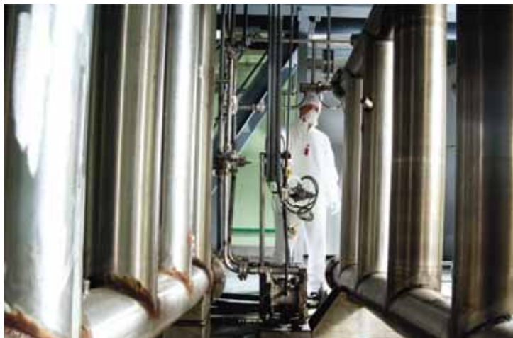
Изготовление порошка диоксида урана. Стадия 1

Остался всего один вопрос: для чего мы выделяли уран и плутоний из ОЯТ?