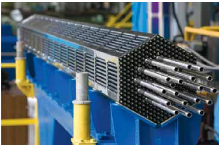
Стенд сварки каркаса ТВС

Обогащенный уран в форме UO_2 при помощи методов порошковой металлургии прессуют в таблетки диаметром порядка 1 см и толщиной 1-1,5 см. Затем эти таблетки помещают внутрь тонкостенной трубки, выполненной из циркония (чрезвычайно стойкого к воздействию высоких температур и агрессивных сред материала), содержащего порядка 1% ниобия. Длина такой трубки, называемой ТВЭЛОМ (тепловыделяющим элементом), может составлять несколько метров (для современных реакторов ВВЭР - 3,5 м). Топлива в ней – более 1,5 кг. Затем несколько твэлов конструктивно объединяются в тепловыделяющую сборку (ТВС).