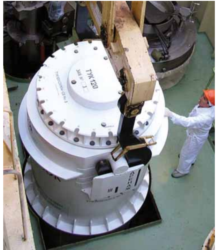
Контейнер для перевозки ОЯТ ТУК120

За всю 25-летнюю историю перевозок ОЯТ по железным дорогам России не произошло ни одной аварии со спецвагонами. Для террористов подобные перевозки также не имеют никакого интереса: взорвать вагон так, чтобы произошел выход радиоактивности, практически невозможно, а украсть контейнер с топливом, имеющий массу порядка 80-100 т – нереально.