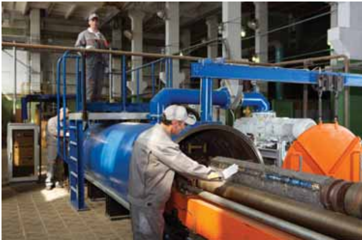
Циркониевое производство на ЧМЗ