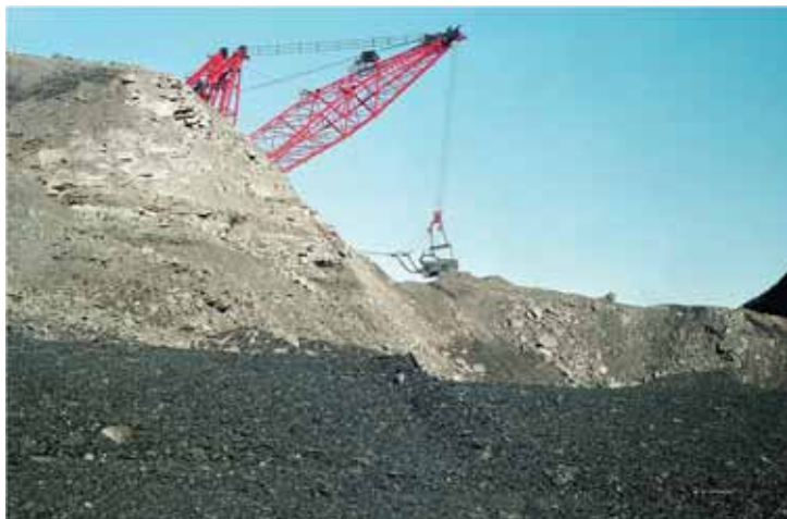
Добыча руды в карьере