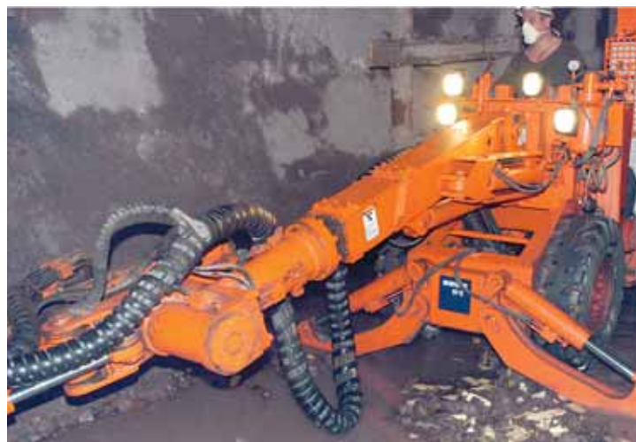
Комбайн в шахте ППГХО

Уран добывают шахтным способом, если в крепких горных породах залегают достаточно выраженные рудные жилы.