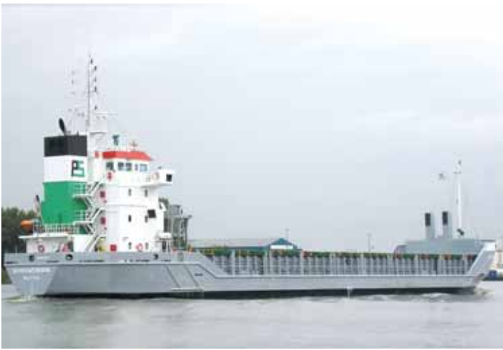
Судно для перевозки ОЯТ

После выдержки в бассейнах топливо железнодорожным транспортом перевозят на Производственное объединение «Маяк» (г. Озёрск, Челябинская область) или «Горно-химический комбинат» (г. Железногорск, Красноярского края), где его хранят или перерабатывают. Кроме того, ОЯТ может перевозиться морским и автомобильным транспортом.