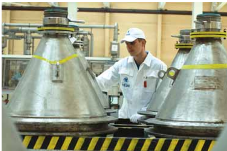
Изготовление порошка диоксида урана. Стадия 2

Ответ чрезвычайно прост – уран возвращается в ядерный топливный цикл в виде свежего топлива. Ведь после переработки уран теряет основную часть своей радиоактивности, становится практически безопасным и, значит, можно повторить (уже с его участием) все вышеописанные операции. Это вполне разумно, учитывая ограниченность запасов урана в России и на планете. По экспертным оценкам, разведанных руд урана хватит на 75-85 лет работы мировой атомной энергетики с учетом современных темпов ее роста.