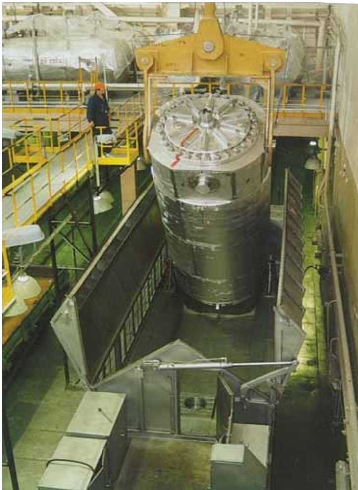
Разгрузка ОЯТ с железнодорожной платформы

После доставки ОЯТ в конечный пункт назначения его снова помещают в хранилище - для дальнейшего снижения уровня радиоактивности и тепловыделения.